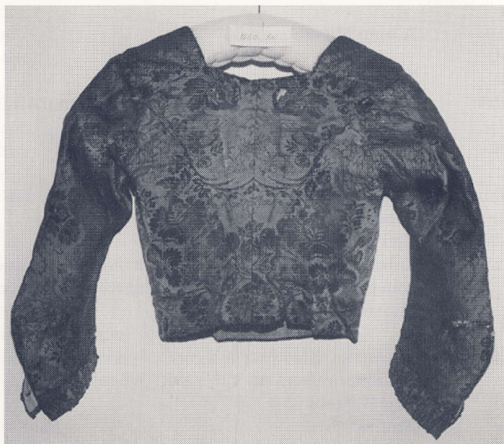
Trøje af brunt blomstret silkedamask. Tilhører Museet på Koldinghus. Nr. 1550