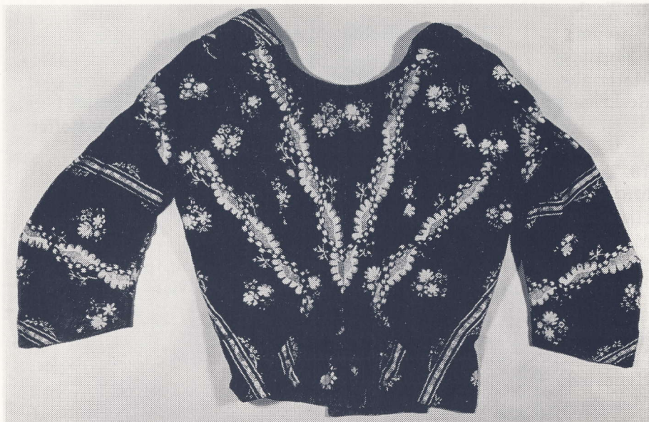
Trøje af trykt kattun. Tilhører Museet på Sønderborg Slot. Nr. D 839.