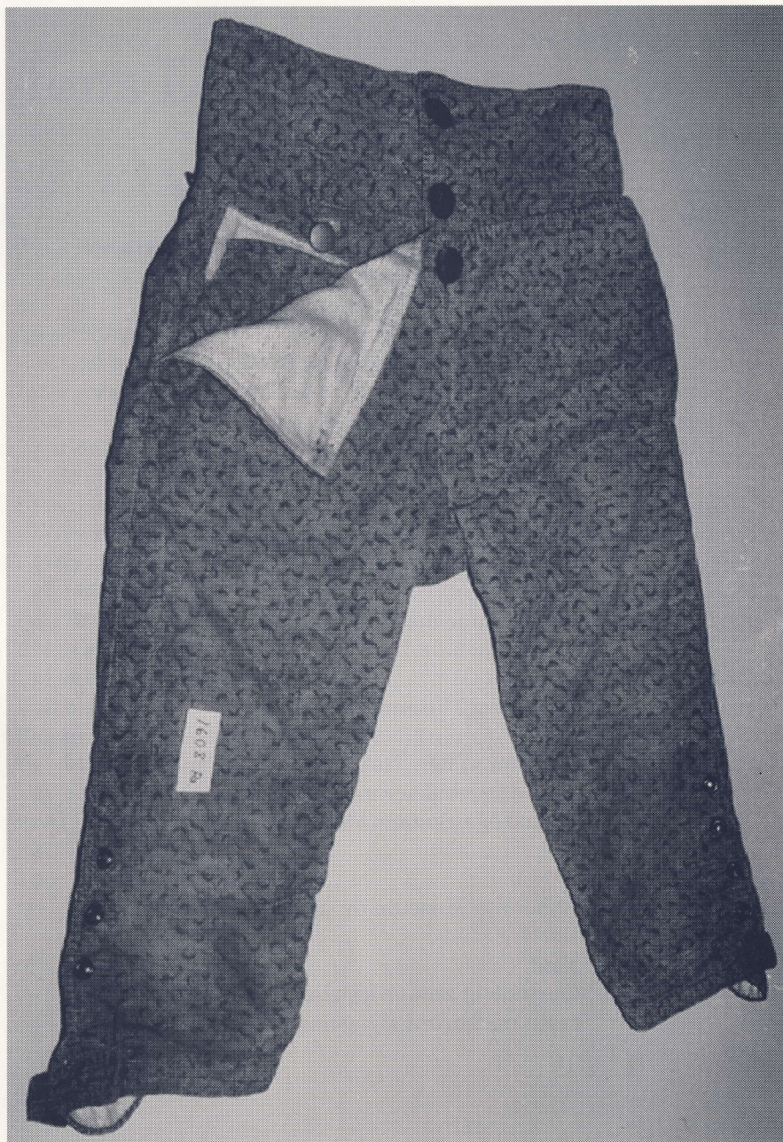
Knæbukser. Oprindeligt grønne i bundfarven. Tilhører Aabenraa Museum nr. 1608.