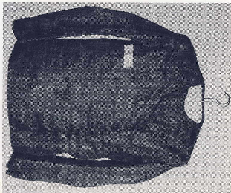
En rød-grøn calemankes trøje med possementsknapper. Flensborg Museum nr. 6706