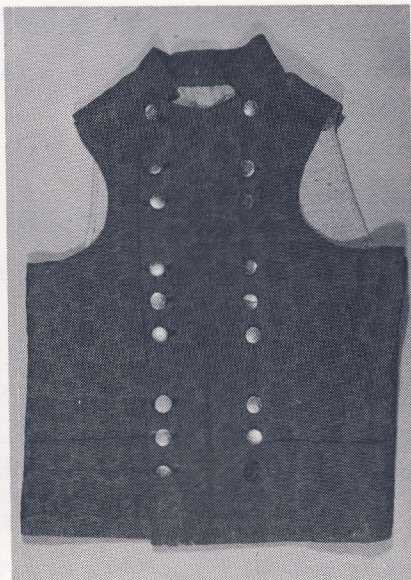
Rød, mønstret mandsvest med to rækker blanke knapper anbragt i grupper på 3 og 3. Ca. 1780-1810 (Flensborg Museum)