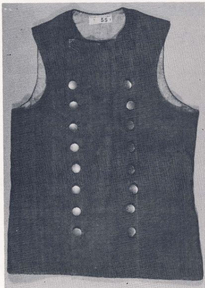
Rød mandsvest med to rækker blanke messingknapper. Ca. 1780-1810 (Altona Museum)