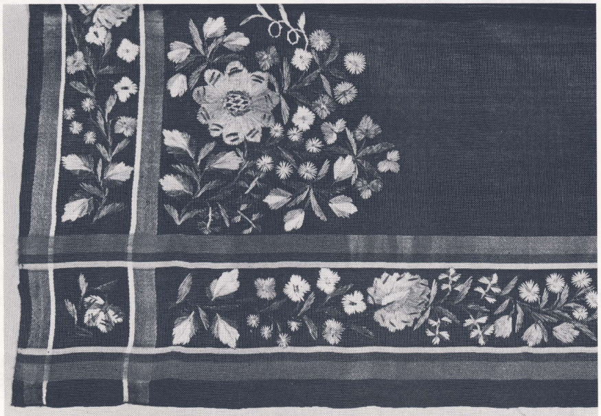
Silketørklæde, broderet med silke i mange farver.