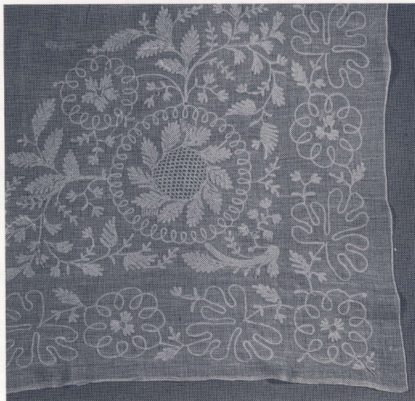
Tambureret hvidt tørklæde.