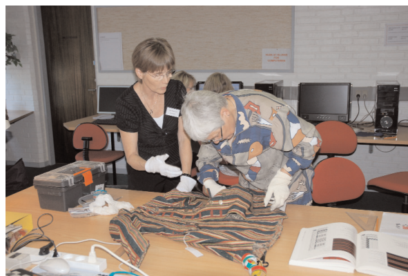
Opmåling af originale dragtdele