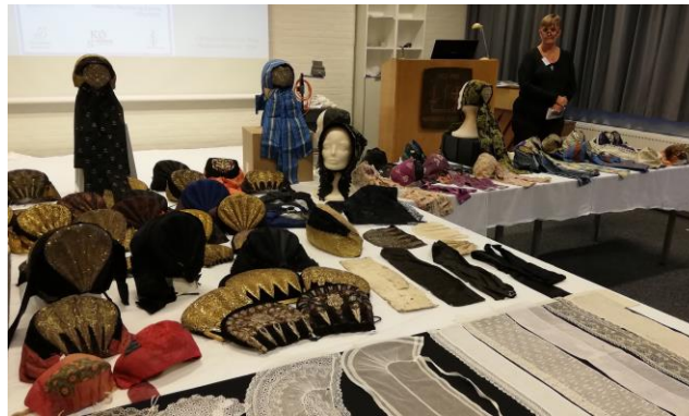
Udstilling og foredrag