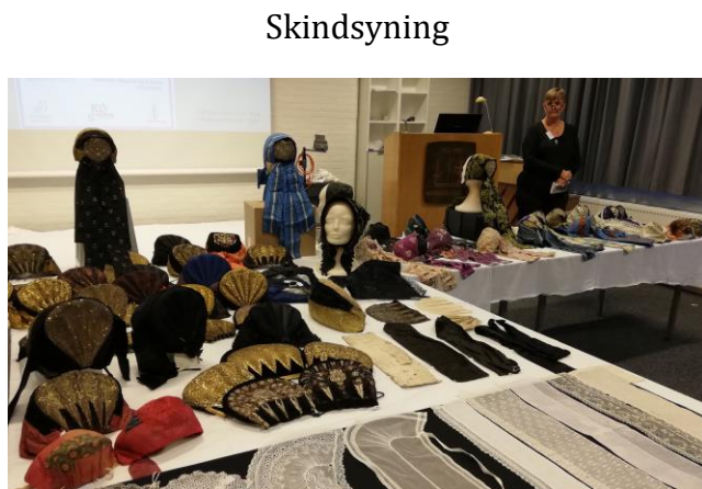
Udstilling og foredrag