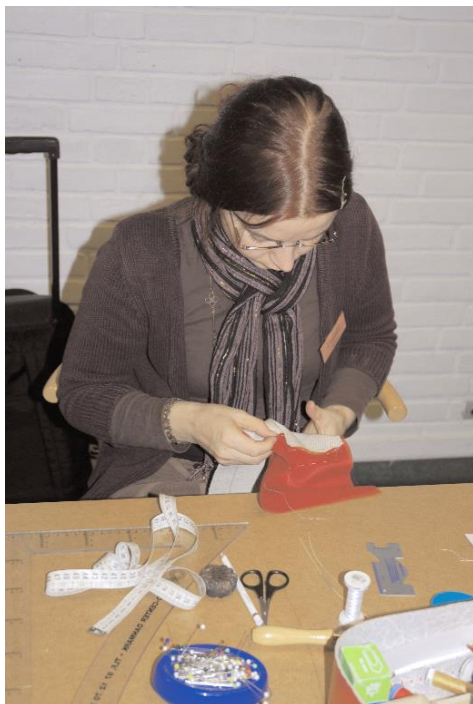
Syning af lomme

Vil blive brugt til fremvisning af dragter, udstilling af gamle dragtdele, samt foredrag med relation til uddannelsens faglige indhold.