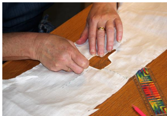
Syning af sark