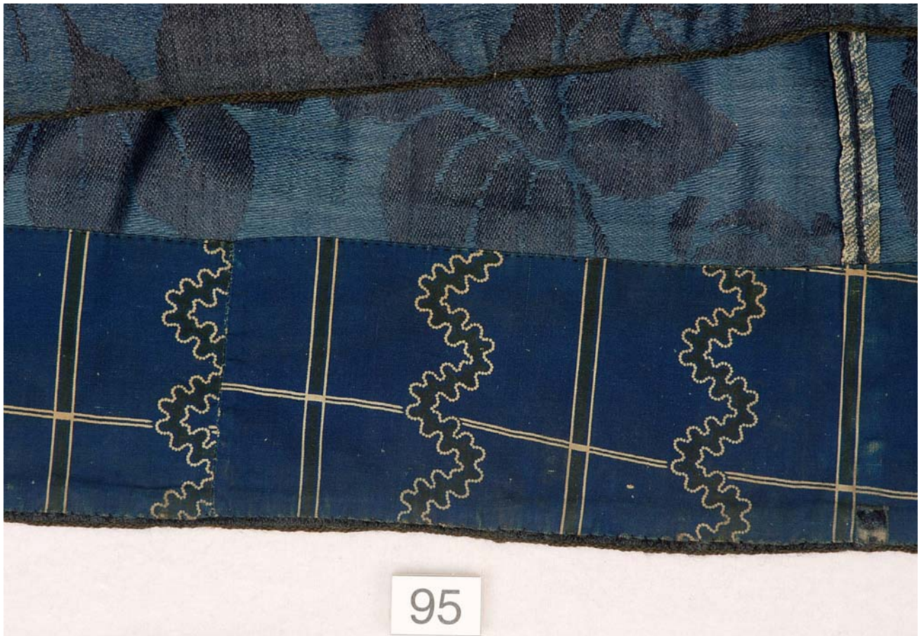
MED SKÆG OG PANDEPUDE VENDELBOTØJ, HOVEDSAGELIG FRA ØSTVENDSYSSEL CA. 1780 – CA. 1850.