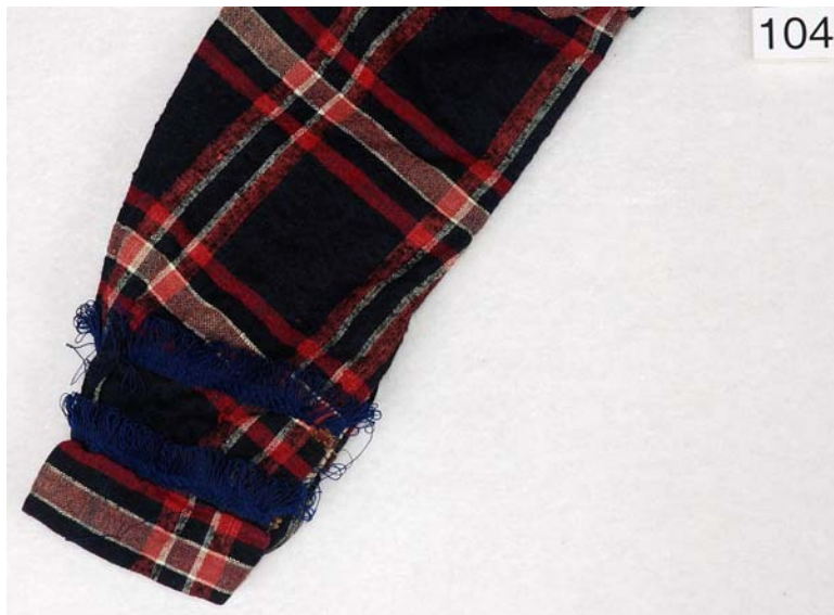
MED SKÆG OG PANDEPUDE VENDELBOTØJ, HOVEDSAGELIG FRA ØSTVENDSYSSEL CA. 1780 – CA. 1850.