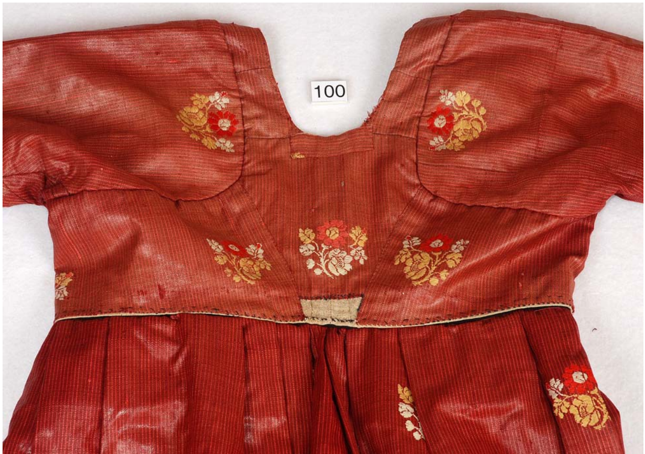
MED SKÆG OG PANDEPUDE VENDELBOTØJ, HOVEDSAGELIG FRA ØSTVENDSYSSEL CA. 1780 – CA. 1850.