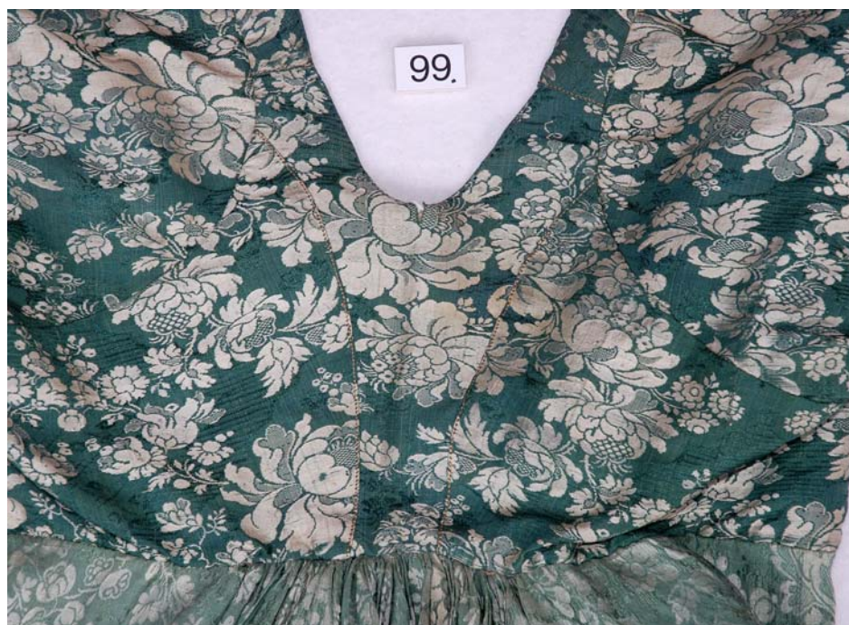
MED SKÆG OG PANDEPUDE VENDELBOTØJ, HOVEDSAGELIG FRA ØSTVENDSYSSEL CA. 1780 – CA. 1850.