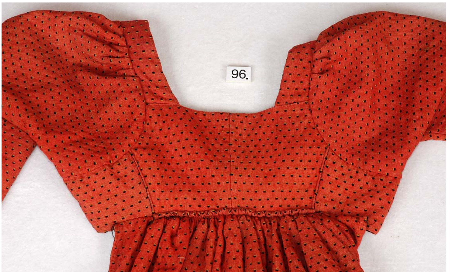
MED SKÆG OG PANDEPUDE VENDELBOTØJ, HOVEDSAGELIG FRA ØSTVENDSYSSEL CA. 1780 – CA. 1850.