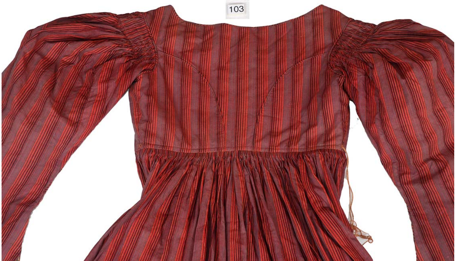
MED SKÆG OG PANDEPUDE VENDELBOTØJ, HOVEDSAGELIG FRA ØSTVENDSYSSEL CA. 1780 – CA. 1850.