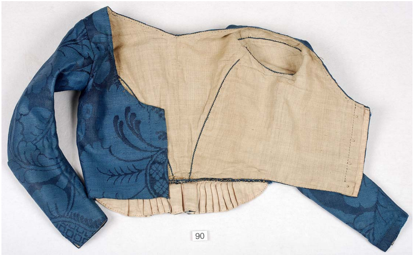
MED SKÆG OG PANDEPUDE COPYRIGHT DanskeFolkedansere. VENDELBOTØJ, HOVEDSAGELIG FRA ØSTVENDSYSSEL CA. 1780 – CA. 1850.