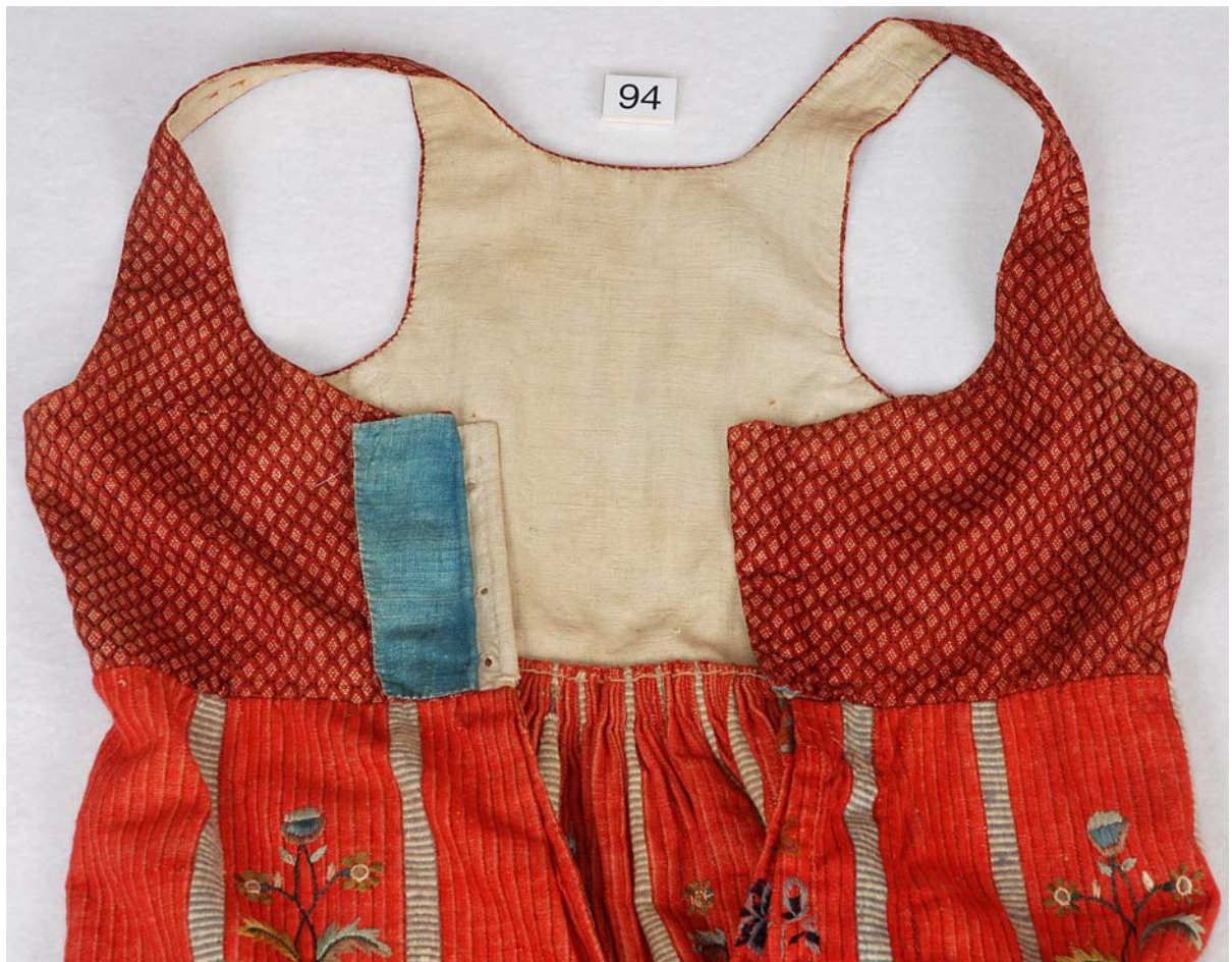
MED SKÆG OG PANDEPUDE COPYRIGHT DanskeFolkedansere. VENDELBOTØJ, HOVEDSAGELIG FRA ØSTVENDSYSSEL CA. 1780 – CA. 1850.