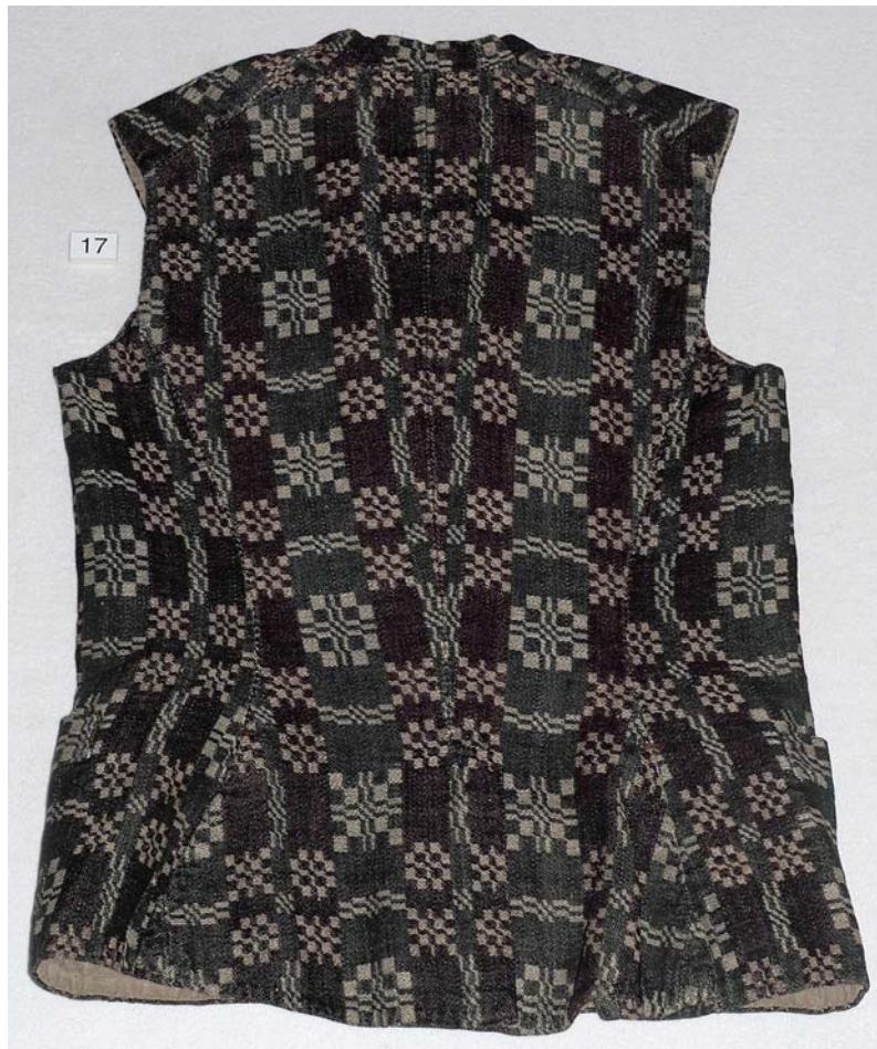
MED SKÆG OG PANDEPUDE VENDELBOTØJ, HOVEDSAGELIG FRA ØSTVENDSYSSEL CA. 1780 – CA. 1850.