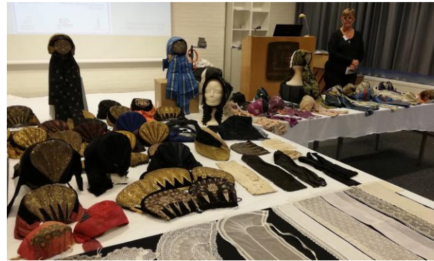
Udstilling og foredrag