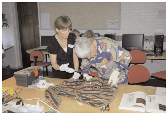
Opmåling af originale dragtdele